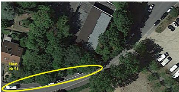
Ansicht in Google Maps des betreffenden Bereichs

Wie in den Anträgen zuvor bleibt die Begründung gleich: Vor dem Treppen-Eingang zur Schule und bis zum Eingang zur Mehrzweckhalle ist eine Parkmarkierung auf der Straße aufgebracht und somit ist das Parken hier erlaubt. Allerdings parken in diesem Bereich vorwiegend Wohnmobile, Anhänger, Sprinter und sogar belegte Bootsanhänger geparkt, vielfach auch als Dauerparkplatz. Durch die Höhe dieser Fahrzeuge ist der Eingang bzw. der Treppenaufgang zur Schule nicht einsehbar. Das bedeutet eine erhebliche Gefahr für die Kinder beim Betreten oder Verlassen der Schule. Auch für vorbeifahrende Autos ist die Lage in dieser Kurve somit unübersichtlich.