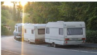
Typische Parkplatzsituation im bezeichneten Bereich

Farsin Alikhani, Stadtteiljugendbeauftragter