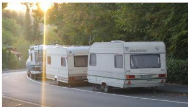
Typische Parkplatzsituation im bezeichneten Bereich