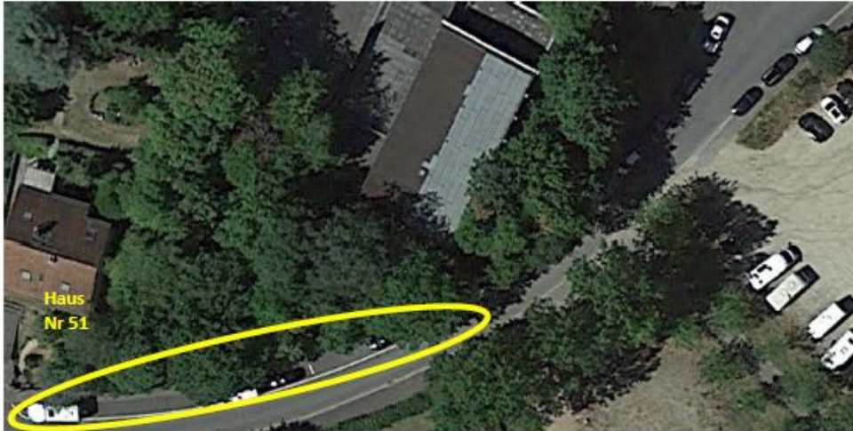
Ansicht in Google Maps des betreffenden Bereichs